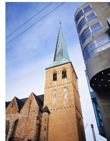
St. Petri

Dortmund , das östliche Ende des Ruhrgebiets ist heute unser Ziel. Wir lernen die evangelische Stadtkirche St. Petri mit ihrem goldenen Altar, genannt „Das goldene Wunder“ kennen. Bei einer Stadtrundfahrt kommen wir auch zum neuen Wohnviertel am Phönixsee , wo wir einen geführten Bummel durch das ehemalige Industriegelände machen können.