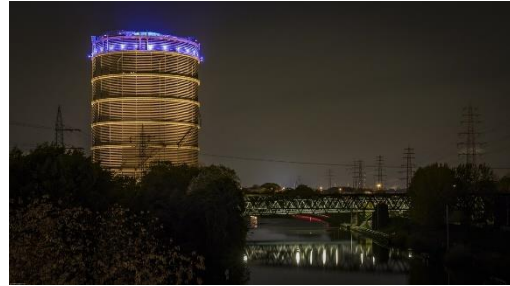
Gasometer in Oberhausen

Am Nachmittag geht es zum „Gasometer“ nach Oberhausen , ein Industriedenkmal, das heute eine Ausstellungshalle beinhaltet, in der derzeit die Ausstellung „Planet Ozean“ läuft: faszinierende Bilder der Tiefsee und vom Leben im, mit und auf dem Wasser.