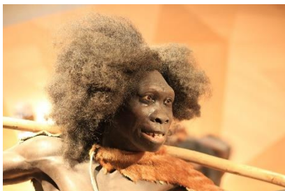
Neandertal-Museum in Mettmann

Wir machen uns auf dem Heimweg. Doch dabei wollen wir bei unseren „Vorfahren“, den Neandertalern vorbeischaun. Bei Mettmann , in der Nähe der Fundstelle der ersten Neandertalerknochen ist ein wunderschönes Museum entstanden, das die Menschheitsgeschichte sehr gut darstellt. Auch die Rolle der Neandertalerin ist dabei gut herausgearbeitet.