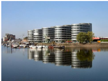
Hafen in Duisburg

Diesen Tag wollen wir in Duisburg verbringen. Hier fließt die Ruhr in den Rhein und daher hat die Stadt den größten Binnenhafen Europas. Bei einer Hafenrundfahrt werden wir die Bedeutung des Hafens und der Wasserstraßen kennenlernen. Da Wasserwege aber die ältesten Verkehrswege sind, hat Duisburg auch eine lange Geschichte: Schon im 10. Jahrhundert wurde auf dem Burgplatz eine Königspfalz gegründet. Um das Jahr 1000 wurde eine romanische Kirche errichtet, die Vorgängerkirche der heutigen Salvatorkirche. Ein berühmter Sohn der Stadt war Gerhard Mercator (1512-1594), ein Kartograph, der die