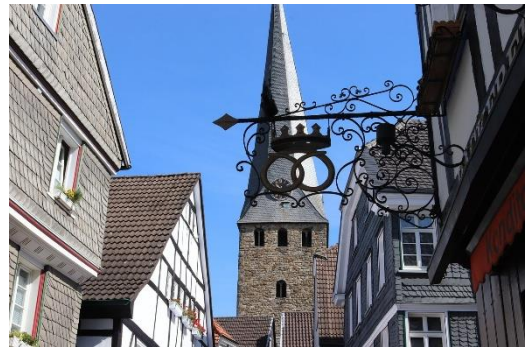
Schiefer Turm in Hattingen

Dann geht es weiter nach Essen , wo wir im Hotel die nächsten Nächte verbringen werden. Dort werden wir auch zu Abend essen.